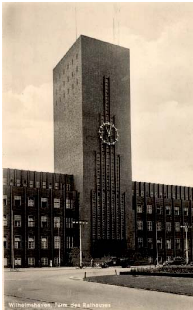
Wilhelmshaven, Turm des Rathauses

verwaltung.@bbs-whv.de www.bbs-wilhelmshaven.de