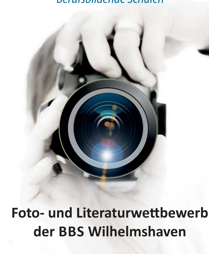
Foto- und Literaturwettbewerb der BBS Wilhelmshaven